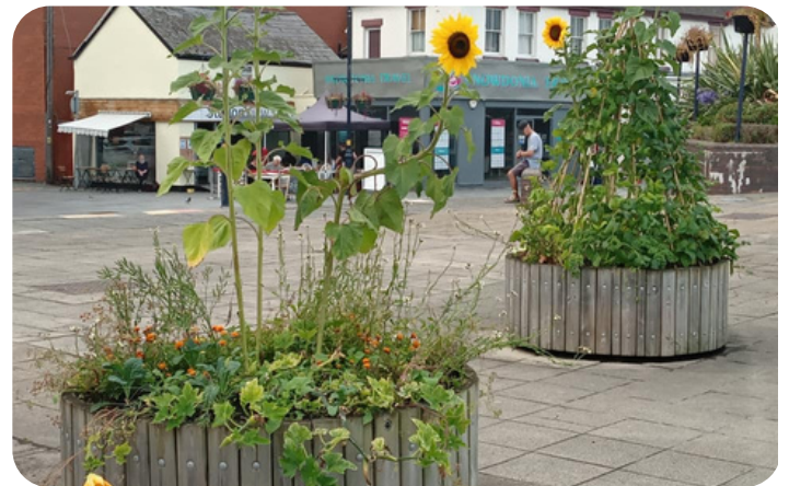
Canol Tref Bae Colwyn

Mae cynghorau cymuned a thref mewn sefyllfa dda i feithrin prosiectau tyfu newydd. Yn aml maent yn rheoli neu yn berchen ar dir, maent yn adnabod eu cymunedau yn dda ac wedi'u rhwydweithio'n dda gyda sefydliadau defnyddiol eraill sy'n gallu cynnig cefnogaeth. Yn dibynnu ar faint o dir sydd gennych ar gael a sydd eisiau cymryd rhan, gall prosiectau tyfu cymunedol amrywio o gwpl o welyau uchel o berlysiâu neu ffrwythau, i safle rhandir! Mae sefydlu safle rhandiroedd newydd y tu hwnt i gwmpas y canllaw hwn ond gallwch ddod o hyd i gyngor manwl yn y canllaw hwn a gynhyrchwyd gennym ar gyfer Llywodraeth Cymru .