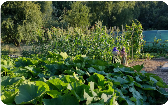
Gardd Gymunedol Meadow Street, Cyngor Tref Pontypridd

Mae'r rhan fwyaf o brosiectau tyfu cymunedol yn defnyddio egwyddorion organig, gan flaenoriaethu iechyd ac ecoleg. Bydd adeiladu pridd iach a gweithio gyda natur o fudd i bobl a natur. Tyfwch blanhigion sy'n addas i'ch sefyllfa chi - yn hytrach na'r rhai sydd angen llawer o baratoi i oroesi - a defnyddiwch dechnegau organig fel plannu cydymaith ac amlddiwylliannau i amddiffyn eich cynnyrch. I gael rhagor o wybodaeth am dyfu organig rhowch gynnig ar wefan Gardd Organig .