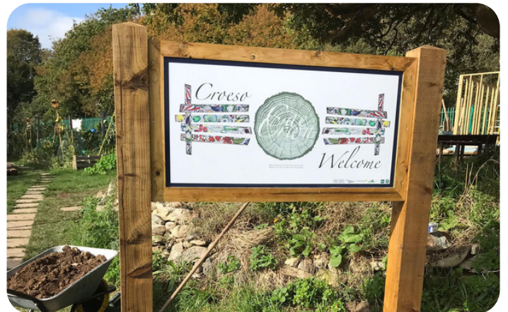
Cae Crwn, Criccieth - gwaith celf gan Cyngorydd Ffion Gwyn, Cyngor tref Criccieth

Mae arwyddion yn bwysig mewn unrhyw ofod tyfu – ni fydd llawer o bobl sy'n cerdded drwyddo o reidrwydd yn gwybod beth sy'n digwydd – bydd arwyddion hardd yn eu helpu i ddeall ac ymgysylltu. Mae celf yn gwella unrhyw ofod cymunedol – mae yna bobl greadigol ym mhob cymuned yng Nghymru! Chwiliwch amdanynt a'u hannog i gyfoethogi eich gardd gyda chelf a cherfluniau hardd, boed yn fyrhoedlog neu'n barhaol.