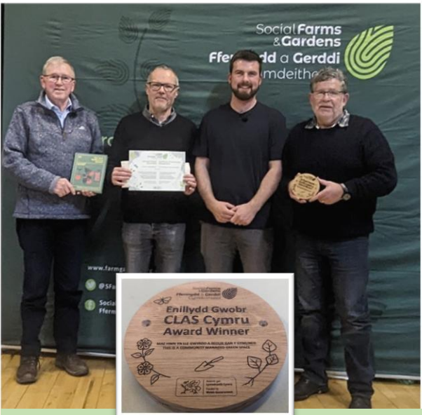
Gwobr CLAS Cymru am Ymgysylltu Cymunedol

Mae grŵp gwirfoddolwyr 'Ffrindiau Betws' yn rheoli'r