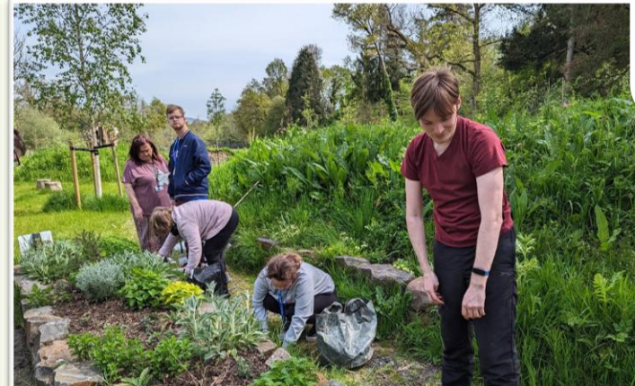
Mae bwyd yn cael ei rannu gyda'r gymuned